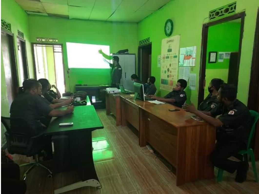
FOTO SAAT KOORDINASI DENGAN STAKEHOLDERS